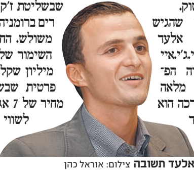
אלעד תשובה

מחיר של 1.69 שקלים למניה – 41% מעל מחיר המניה אתמול בתחילת המסחר. המניה הגיבה ביינוק של 30% למחיר של 1.56 שקלים. ביוני פרסמה טי.ג'י.איי הצעת רכש מלאה למניות אלעד אירופה לפי מחיר של 1.33 שקלים למניה, אך זו נכשלה לאחר אחת בנפרד, הצעה לביצוע מולך של מיווג משולש הופכי, שבו ימווג החברות הבורסאיות לתוך חברות פרטיות תמורת תשלום במוזמן לבעלי המניות. אך בעוד שתשובה מציע לבעלי המניות של אלעד אירופה פרמיה נכבדת על מחיר הבורסה, בר מנסה למחוק את כרמל מתחת לשווי השוק. לפי ההצעה שהגיש תשובה, תמוג אלעד אירופה לתוך טי.ג'י.איי השקעות, החברה הפי רטית בבעלות מלאה של תשובה, שדרכה הוא מחזיק באלעד אירופה. החברה הודיעה כי הצדדים עדיין מנהלים תביעה לפי