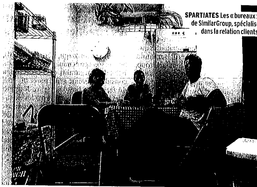
SPARTIATES Les « bureaux » de SimilarGroup, spécialisé dans la relation clients.