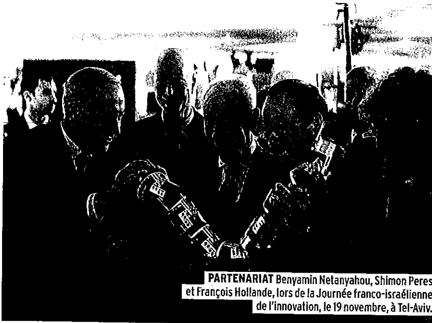
PARTENARIAT Benjamin Netanyahu, Shimon Peres et François Hollande, lors de la Journée franco-israélienne de l'innovation, le 19 novembre, à Tel-Aviv.