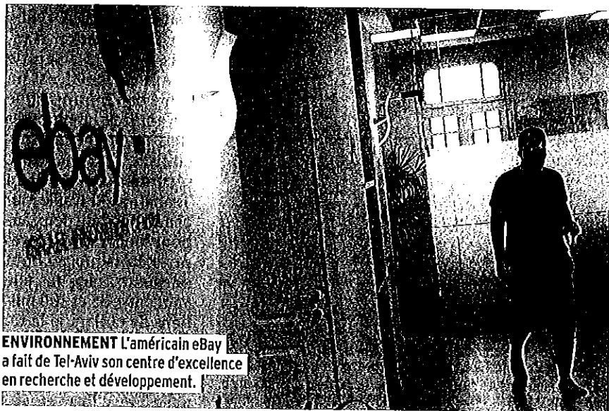
ENVIRONNEMENT L'américain eBay a fait de Tel-Aviv son centre d'excellence en recherche et développement.

En attendant que le miracle de la high-tech ait davantage de retombées sur l'ensemble du pays, les champions des exit redistribuent – un peu – leur (bonne) fortune, via Tmura. L'organisme à but non lucratif a demandé à 250 sociétés prometteuses de lui offrir des parts de leur capital, à valoriser en cas de cession. Cette riche idée rapporte : rien qu'avec la vente de Waze, Tmura a récolté 1,5 million de dollars. Un pactole utilisé pour aider les enfants défavorisés à surmonter la fracture numérique. Et qui sait, un jour, à créer leur propre start-up. ● C. S.